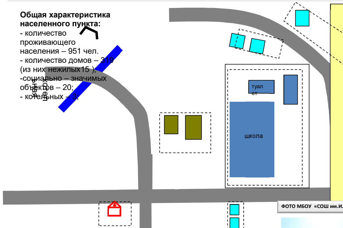
ФОТО МБОУ «СОШ им.И.